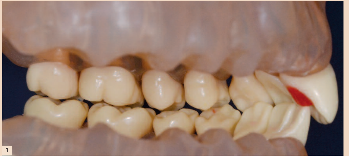
Abb. 1: Fracomodell mit dem 2. und 3. Quadranten, Plateau an 21 palatinal, Disklusion seitlich.

Die Literatur zeigt, dass Bissstufenhöhen von wenigen Millimetern problemlos toleriert werden und somit die Schienenbehandlung in allen Berichten positiv verläuft und nicht notwendig ist, sofern der Patient nicht schon Kiefergelenkssymptome aufzuweisen hat. Beim Austausch der provisorischen Versorgung gegen die definitive sind der Entfernungsbedarf, Nachpräparationsbedarf, das womöglich erneute Herstellen von Zwischenprovisorien sowie die diffizile Bissnahmetechnik sehr aufwendig.